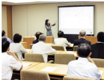
▲議員研修会の様子