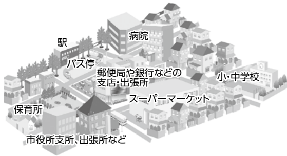
▲市街地部の地域拠点のイメージ

本市では、「ネットワーク型コンパクトシティ」(以下「NCC」)の形成を目指しています。NCCとは、今後、人口減少や高齢化が進む中で、自動車がなく