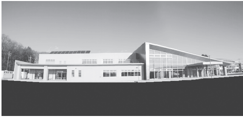
▲新河内地域自治センター

▽主な業務 地域防災、まちづくり活動支援業務、住民票・戸籍などの窓口業務、介護保険、母子健康手帳などの保健福祉業務。