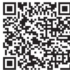
▲防災メール登録用QRコード

ては、県☎ http://www.pref.tochigi.lg.jp/r/防災メールの配信 と検索。携帯電話は、右のQRコードを読み取って登録することもできます。 ▽市内の情報(測定値) 市☎「うつのみやの天気」 http://hozenka0711.ec-net.jp/kankyoo/ をご覧ください