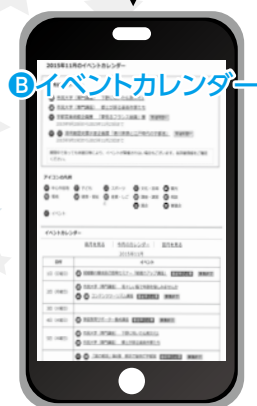
▶ イベントカレンダー