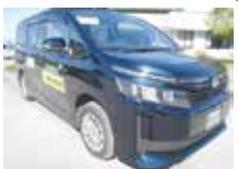
▲篠井はるな号の車両

今回は、地域組織が運営主体となり運行している地域内交通のうち、篠井地区のデマンド型乗り合いタクシー「篠井はるな号」について紹介します。