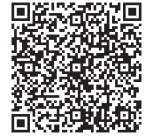
▲携帯サイトQRコード

市土地開発公社 ☎(632)2174、HP http://www.shinoi.com