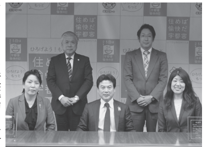
▲平成26年度きらり大賞表彰式

▽申込 男女共同参画課(市役所2階)に置いてある応募用紙(市HPからも取り出し可)に必要な事項を書き、10月30日(必着)までに、直接または送付で、〒320-8540市役所男女共同参画課へ。 ▽その他 平成26年度は、東武宇都宮百貨店、荻原会計事務所が受賞。「きらり大賞」受賞事業者の取り組みは、市HP・ポスターなどで紹介します。