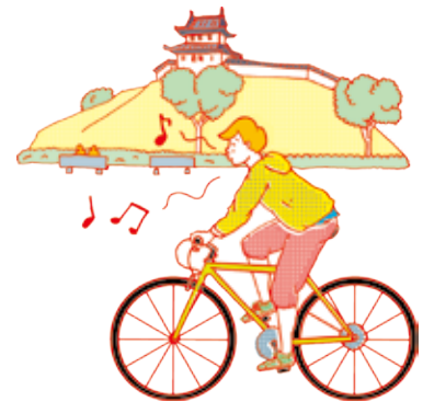
お城の周りの景色はキレイだな～ 宇都宮城址公園 本丸町