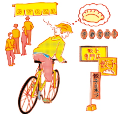
何軒までまわれるかな? 宇都宮餃子 市内各所