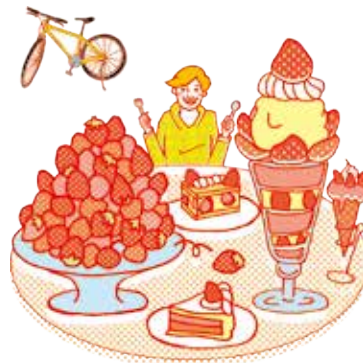
甘くてジューシーなイチゴをガブリ! とちおとめ 市内各所