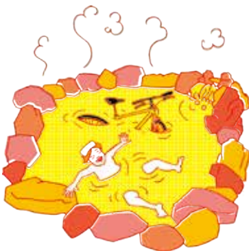
旅の疲れも癒してくれる、大露天風呂! 道の駅うつのみや ろまんちっく村 新里町 ほたるの里 梵天の湯 今里町