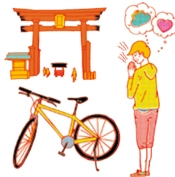
起源は約1600年前。歴史の重みを感じるね。 宇都宮二荒山神社 馬場通り