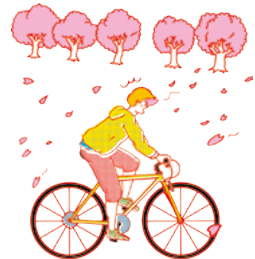
「うつのみや百景」の桜並木を走ると、心がワクワク! 桜並木 陽東7丁目ほか