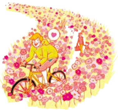
お花や緑に囲まれて楽しいな～ 田川サイクリングロード 東横田町ほか 鬼怒川サイクリングロード 石井町ほか