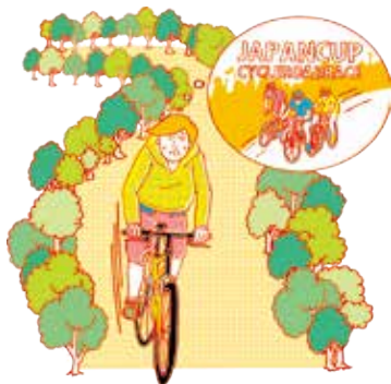
ジャパンカップのレーサー気分! 宇都宮市森林公園 福岡町