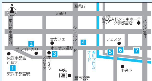
うつのみや大道芸フェスティバル会場

トまたはうつのみや大道芸フェスティバル実行委員会事務局 ① http://www.utsunomiya-daidogei.com /jp/ をご覧ください。 問 うつのみや大道芸フェスティバル実行委員会事務局 (オリオンスクエア管理事務所内) ☎(634)1722、商工振興課 ☎(632)2434