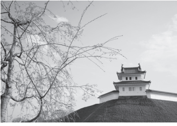
▲宇都宮城址公園と桜

▽対象 和服で来場した中学生以下の男女。 ▽申込 午前11時までに、和服を着用の上、直接、会