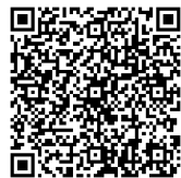
▲携帯サイトQRコード