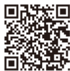
▲消防出動情報QRコード

答え 市携帯サイト ☎(624)2441へ。消防本部通信指令課 ☎(625)5599