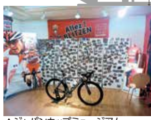
▲ジャパンカップミュージアム

▽会場 森林公園(福岡町)。 ジャパンカップクリテリウム ▽日時 10月18日(土)午後2時~5時。 ▽会場 大通り。 ▽その他 車道上で観戦する「エキサイトゾーン(有料)」を新たに設置。また、オリオンスクエアでパブリックビューイングと表彰式を開催します。 ジャパンカップサイクルロードレース(国際自転車競技連合公認レース) ▽日時 10月19日(日)午前10時~午後2時30分。 ▽会場 森林公園周回コース(1周14.1キロメートル)。 ▽内容 UCIプロチームを含む16チームが参加。 ジャパンカップウィーク ■ ジャパンカップミュージアム ▽期間 10月4~19日。 ▽会場 オリオン通り内。 ▽内容 大会に出場するチームや選手の紹介、写真の展示など総合情報基地。 ■ ジャパンカップ観戦ガイドナイト with JAZZ ▽日時 10月15日(水)午後6時30分。 ▽会場 オリオンスクエア。 ▽内容 注目選手やポイントの解説と飲食ブース。 ■ サイクルフィルムフェスタ ▽日時 10月16日(木)午後6時30分。 ▽会場 オリオンスクエア。 ▽内容 本大会が舞台の映画「茄子 スーツケースの渡り鳥」を無料上映。 ■ ジャパンカップウェルカムライブ ▽日時 10月18日(土)午後0時30分~1時と午後1時30分~2時、午後3時~3時30分の3回。 ▽会場 JR宇都宮駅2階改札前。 ■ ジャパンカップアフターパーティー ▽日時 10月19日(日)午後6時30分。 ▽会場 オリオンスクエア。 ▽内容 スペシャルゲストによるトークショーなど。 ▽その他 費用など、詳しくはジャパンカップ公式ホームページ http://www.japancup.gr.jp/ をご覧ください。