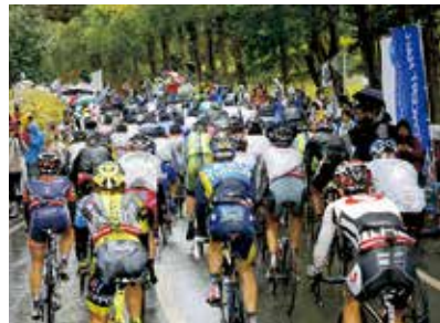
▲サイクルロードレース