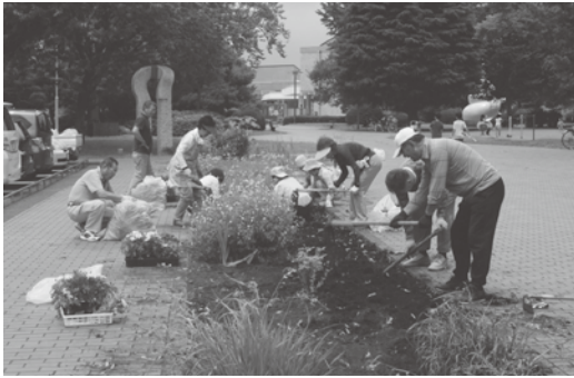
▲ボランティア活動

市では、高齢者の皆さんが、充実した高齢期を送ることができるよう、また、まちづくりの担い手として活躍できるように、社会参加や健康づくり、生きがいづくりを支援します。 この事業は介護保険事業として実施するもので、市社会福祉協議会ボランティアセンター（中央1丁目・市総合福祉センター8階）に事前に活動を登録した団体やグループが取り組む活動に、高齢者が参加した場合、その実績に応じて交換可能なポイントがもらえるものです。貯めたポイントは、翌年度に市の施設利用券やバスカードなどへの交換、ボランティア団体などへの寄付、介護保険料