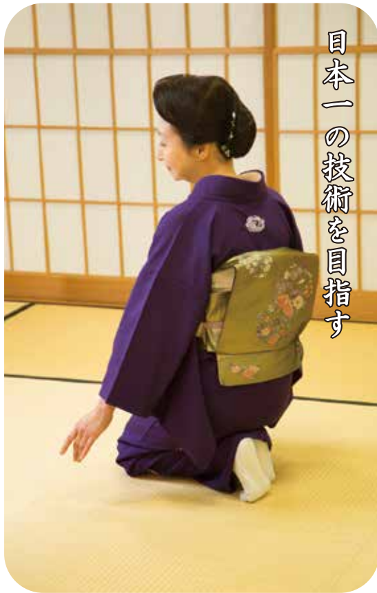
日本一の技術を目指す