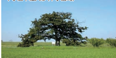
下小倉下組大杉(下小倉町)