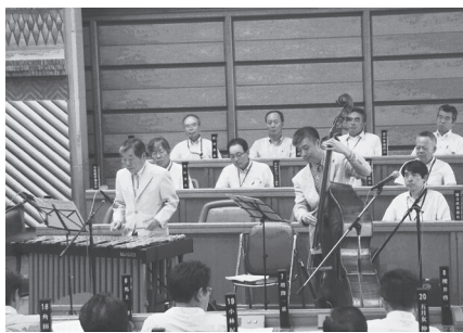
▲昨年のコンサート

▽申込 6月4日から、電話で、市サイクリングターミナル ☎(652) 4497へ。