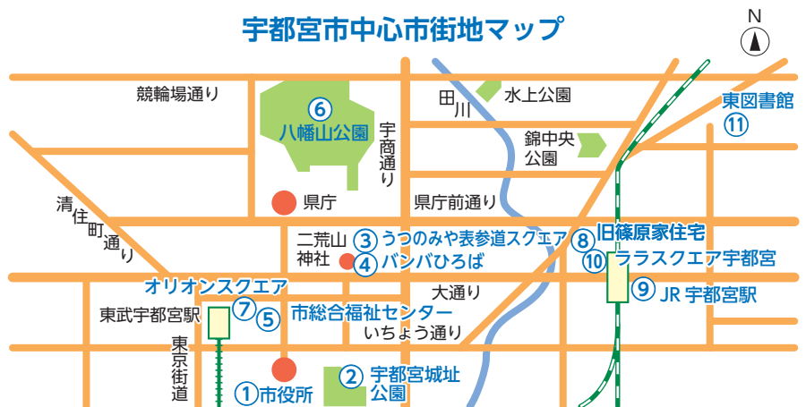
宇都宮市中心市街地マップ