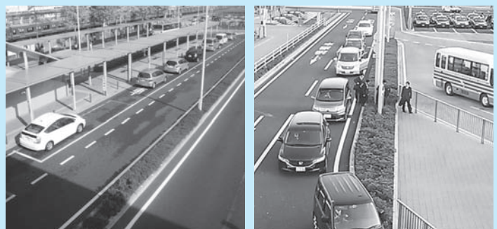
▲駐停車の際は前に詰めましょう ▶植え込みをまたいで通ってはけません