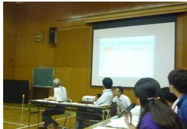
③ 医療機関の被災状況確認のロールプレイ