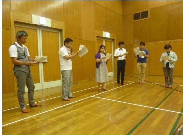
① 職員参集のロールプレイ