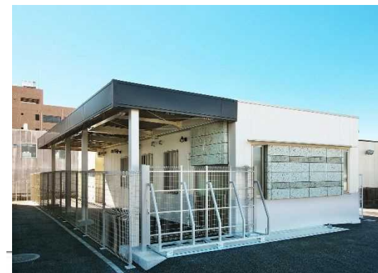
愛護ふれあい棟 外観