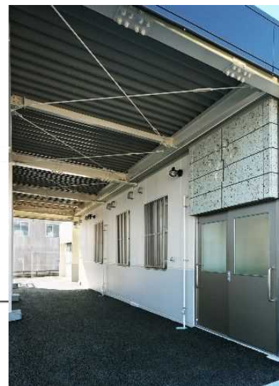
② 愛護ふれあい棟 (新設)