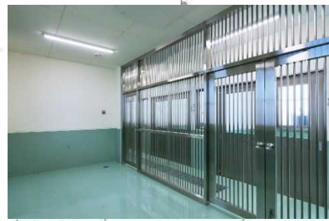
③ ドッグランスペース