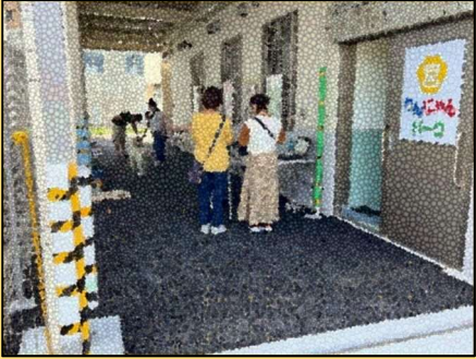
週末ふれあい譲渡会