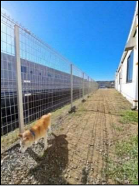
③ドッグランスペース