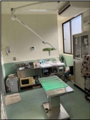
①ケア管理棟 (診察・処置室)