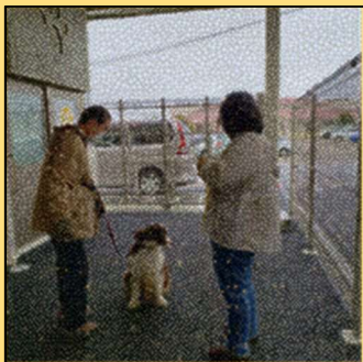
犬の悩みごと個別相談