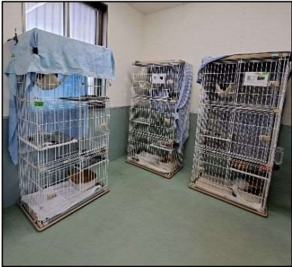
②愛護ふれあい棟 (ふれあい室)