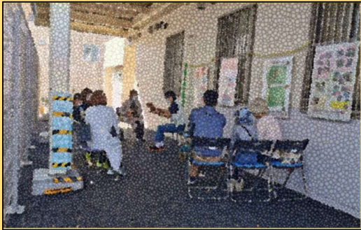
犬の正しい飼い方教室