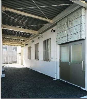
④マッチングエリア