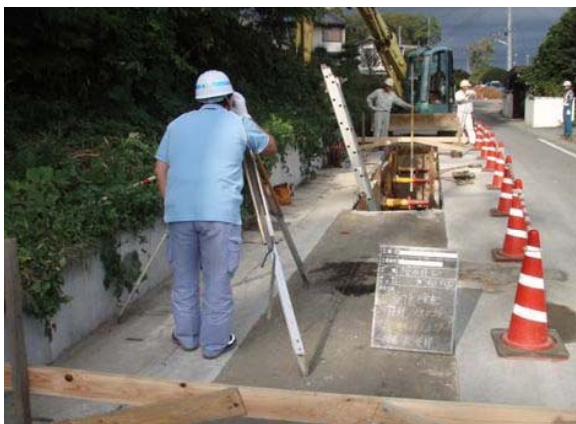
污水管渠深さ検測