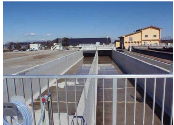
② 水処理3系施設 オキシデーション・ディッチ