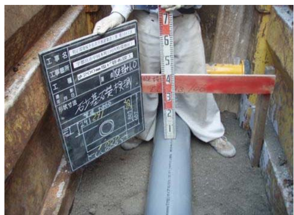
污水管渠布設 (塩ビ管)