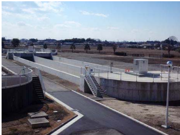
② 水処理3系施設 オキシデーション・ディッチ