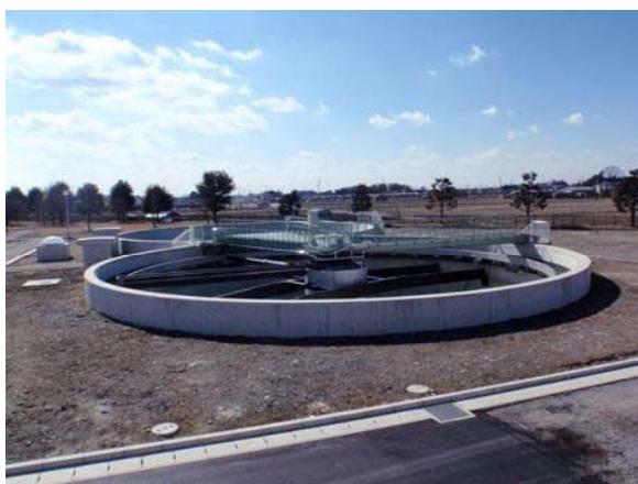
③ 水処理3系施設 最終沈殿池