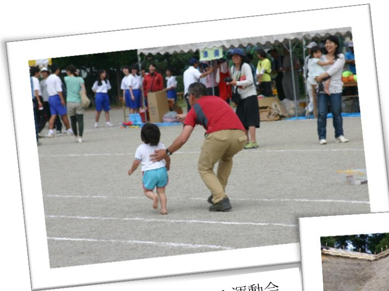
かわちハートフル運動会