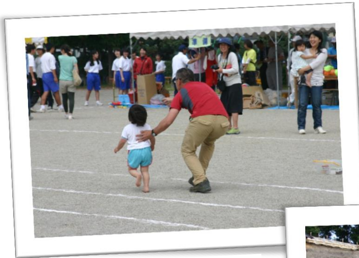
かわちハートフル運動会