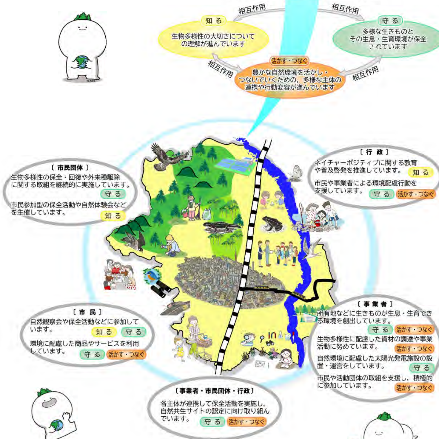
プランの目標に向けた各主体の取組のイメージ