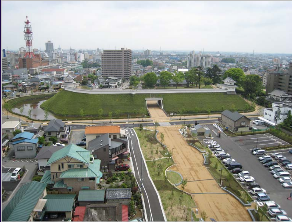
宇都宮城址公園全景