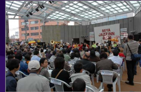
イベントの様子 (ミヤジャズイン)