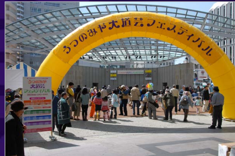
広場活用活性化事業 (写真は大道芸フェスティバル)