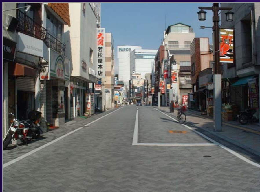
市道6号線（御橋通り）