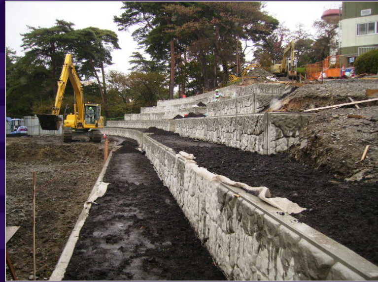
多目的広場（擁壁：現在工事中）