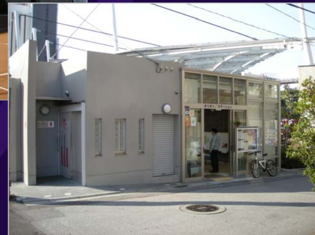
オリオンステーション