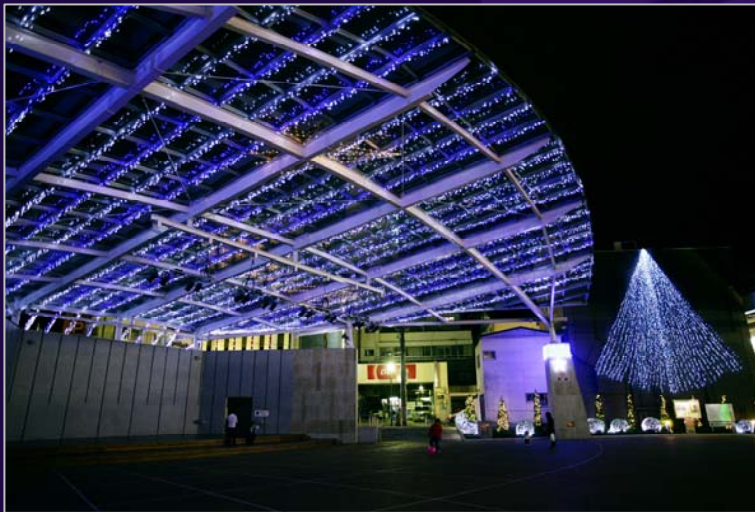
魅力ある商店街等支援事業 (写真はイルミネーション事業)

中心商業地出店等促進事業， 魅力ある商店街等支援事業， 中心商店街景観整備事業， 広場活用活性化事業