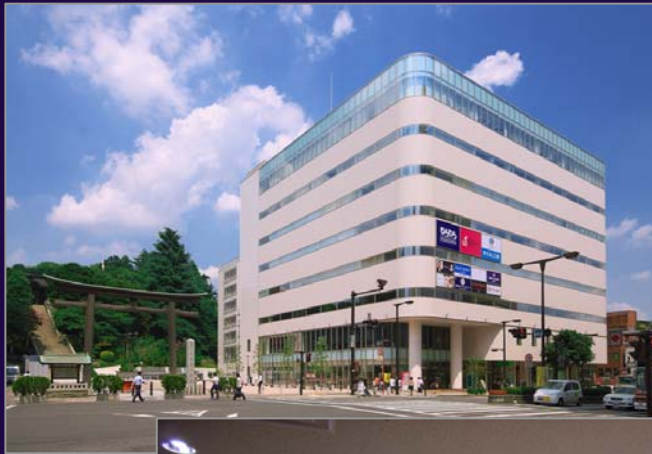
うつのみや 表参道スクエア