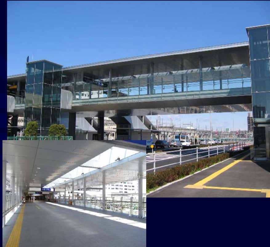
東西自由通路（広場部）