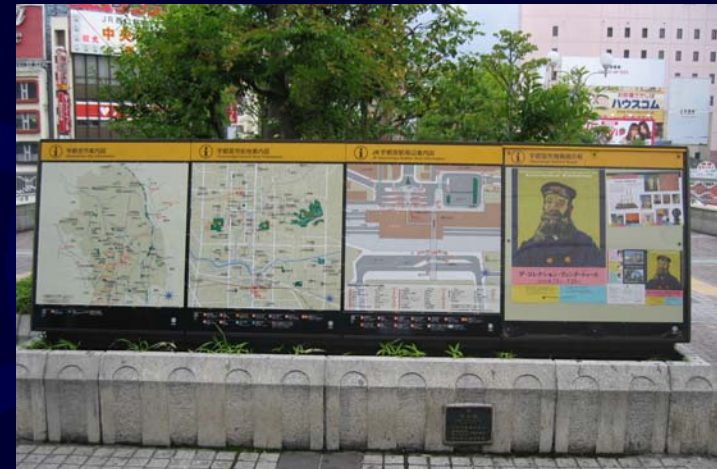
地図サイン（総合案内）