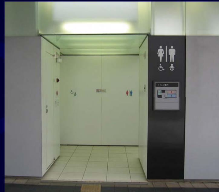
駅東口公衆トイレ