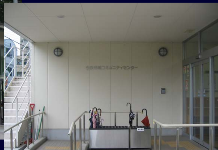
今泉地域コミュニティセンター