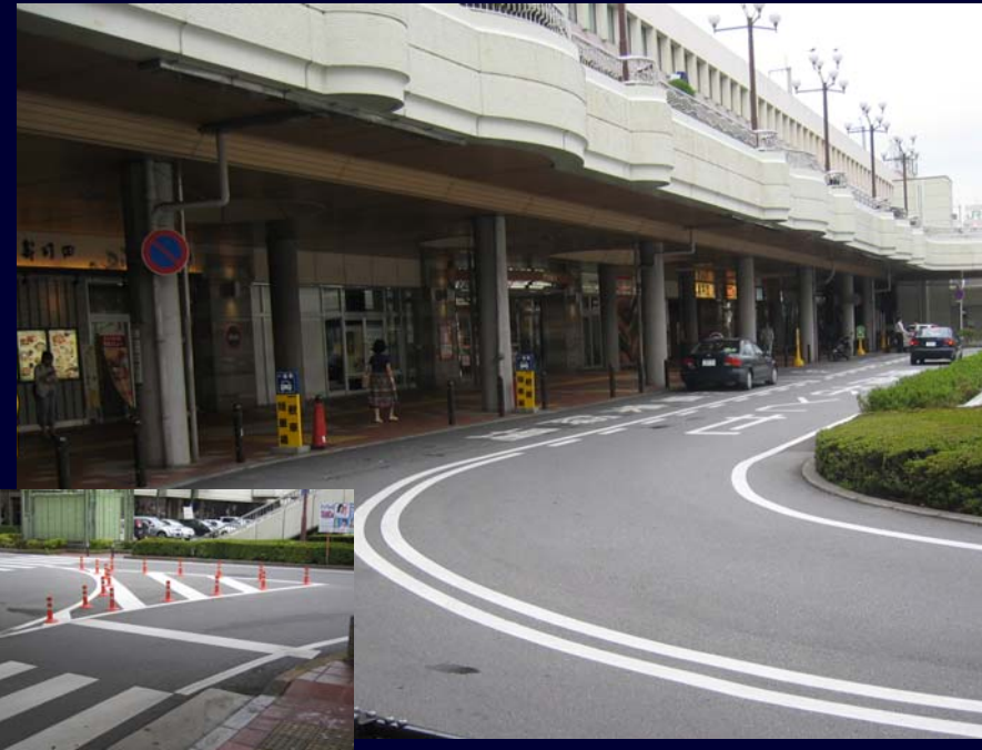
宇都宮駅西口広場 (横断歩道段差解消 等)