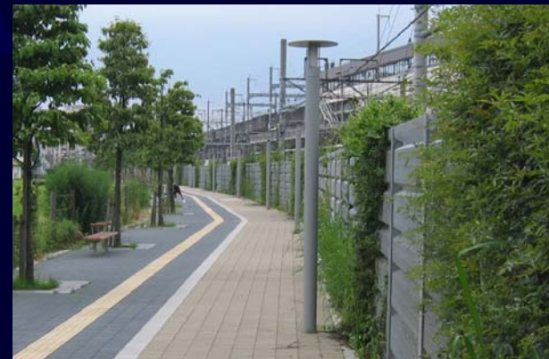
緑化フェンス （自転車歩行者専用道路）