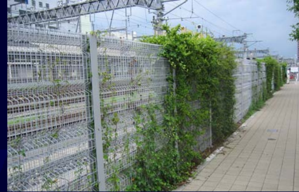
緑化フェンス（駅前広場）