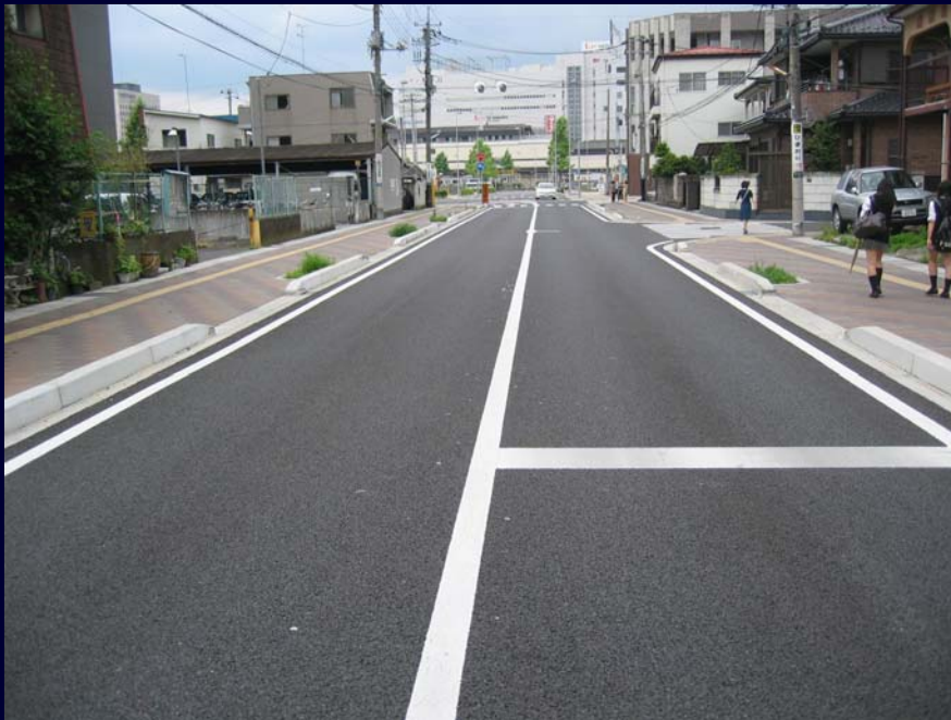
市道929号線 (歩道の拡幅 等)