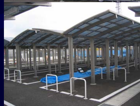
自転車駐車場（屋根：現在工事中）