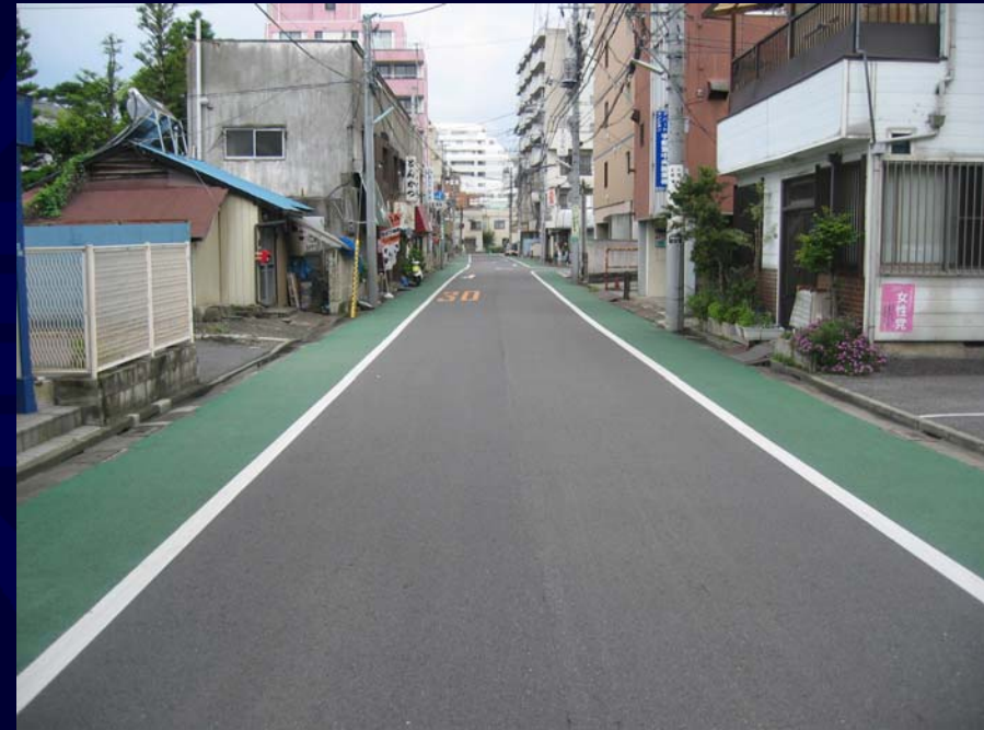
市道1635号線 (カラー舗装 等)