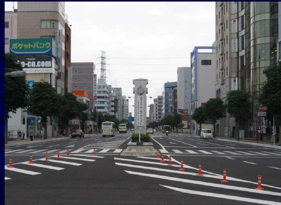
市道1525号線 (歩道の拡幅 等)