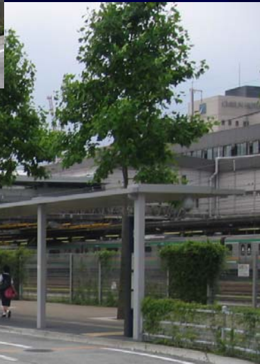
駅前広場乗降場上屋