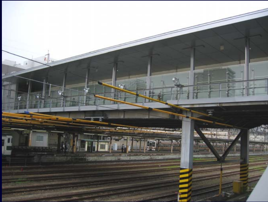
東西自由通路（跨線部）