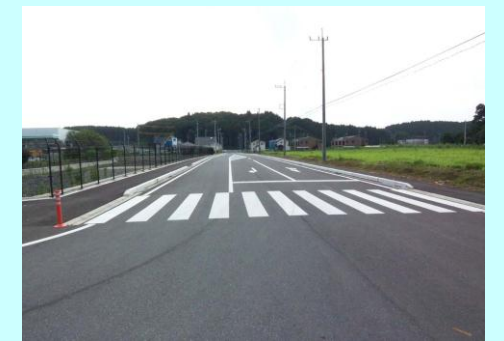
○関連事業: 中里原土地区画整理事業