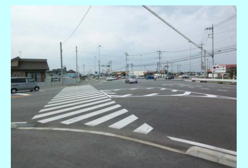
○関連事業: 中里原交差点改良事業