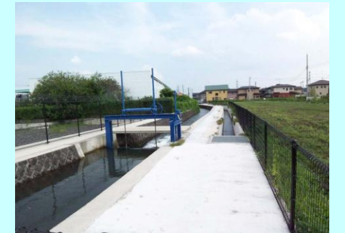
□提案事業: 古用水改修整備事業