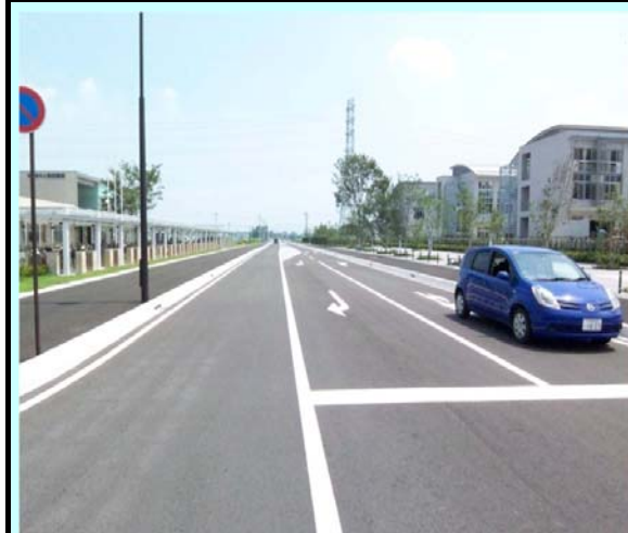
道路事業: 市道5730号線