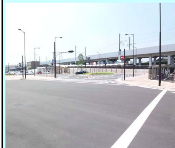
地域生活基盤施設: 雀宮駅東口駅前広場