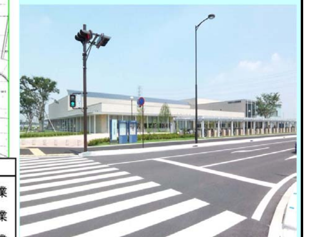
提案事業: 宇都宮市立南図書館