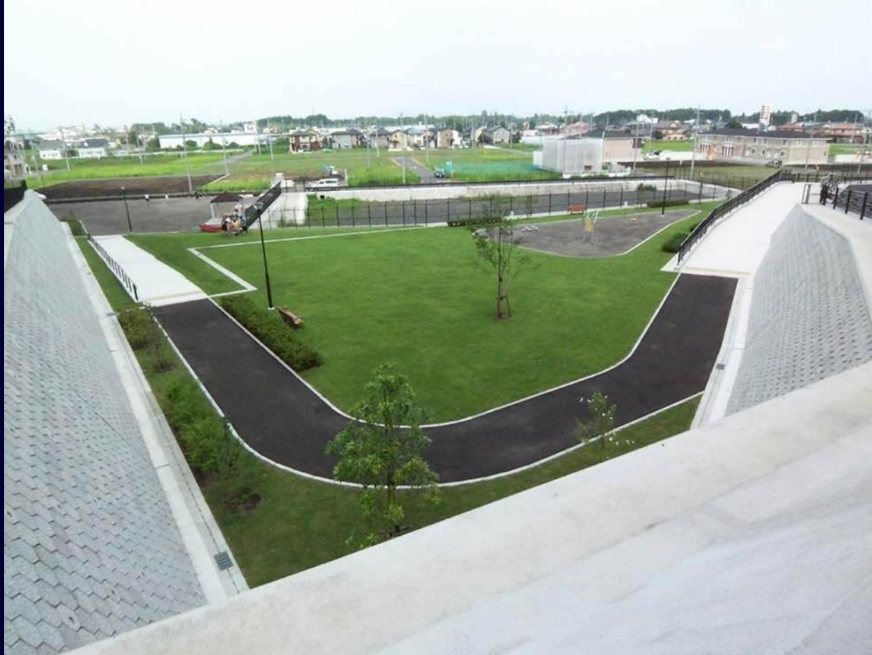
1号公園 (中里原ゆずっこ公園)