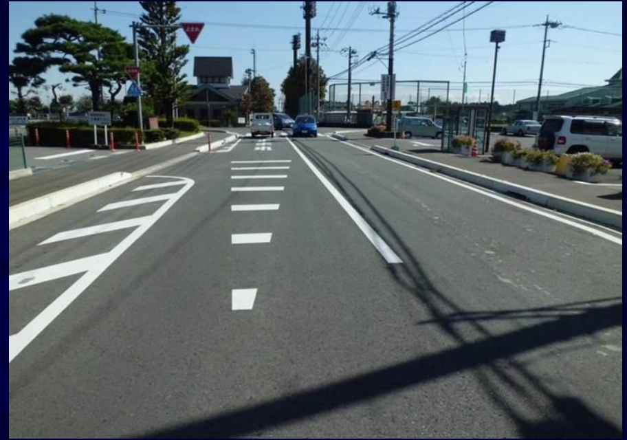
市道10111号線（道路拡幅等）