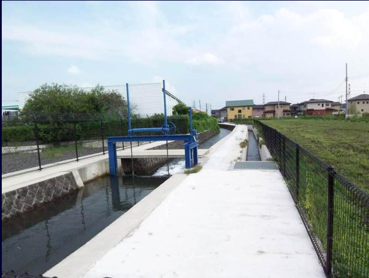
古用水改修整備事業