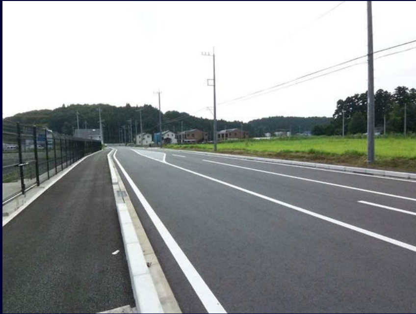
土地区画整理事業地内 区画道路整備（市道13381号線）