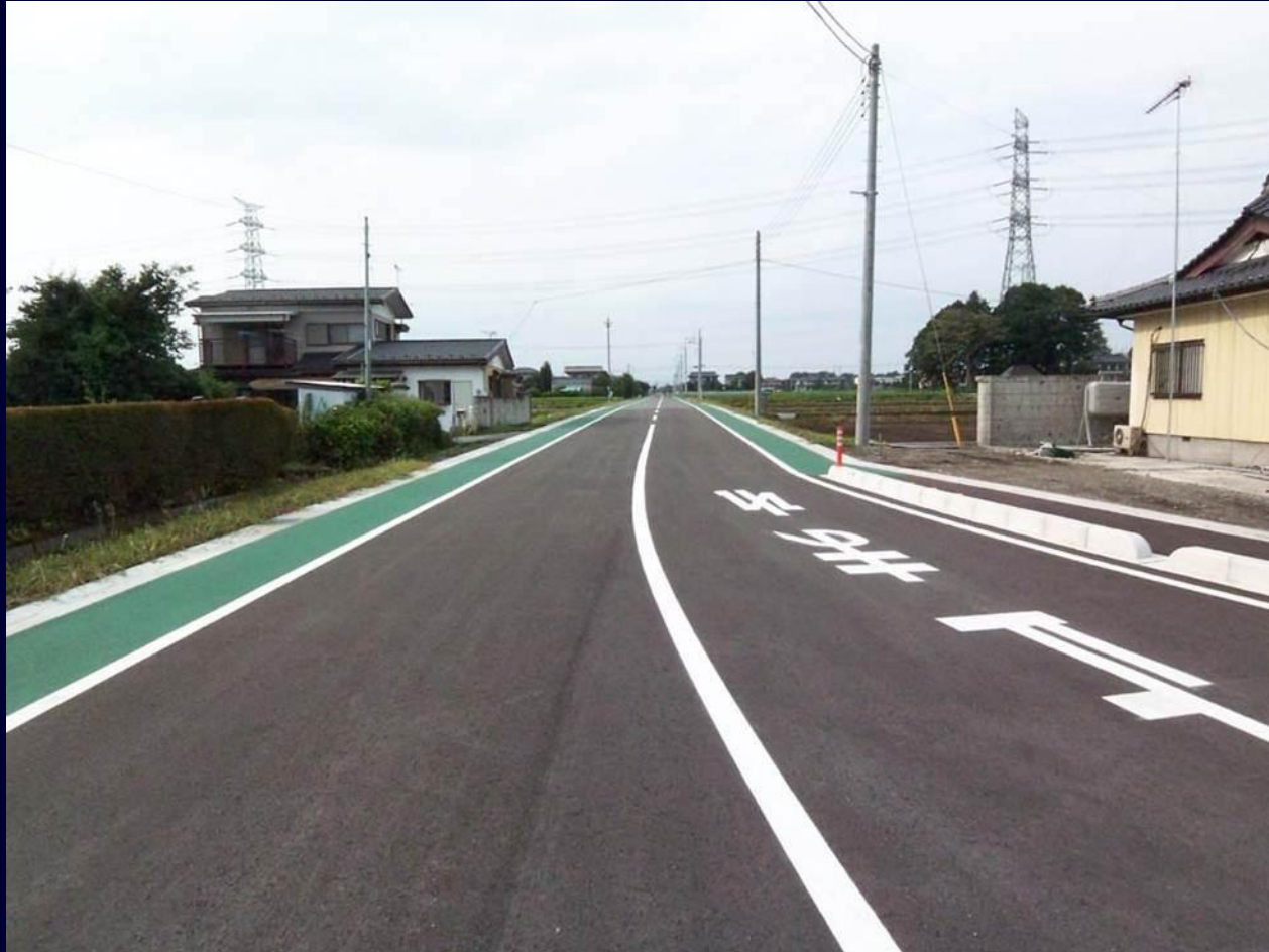
市道13125号線（道路拡幅等）