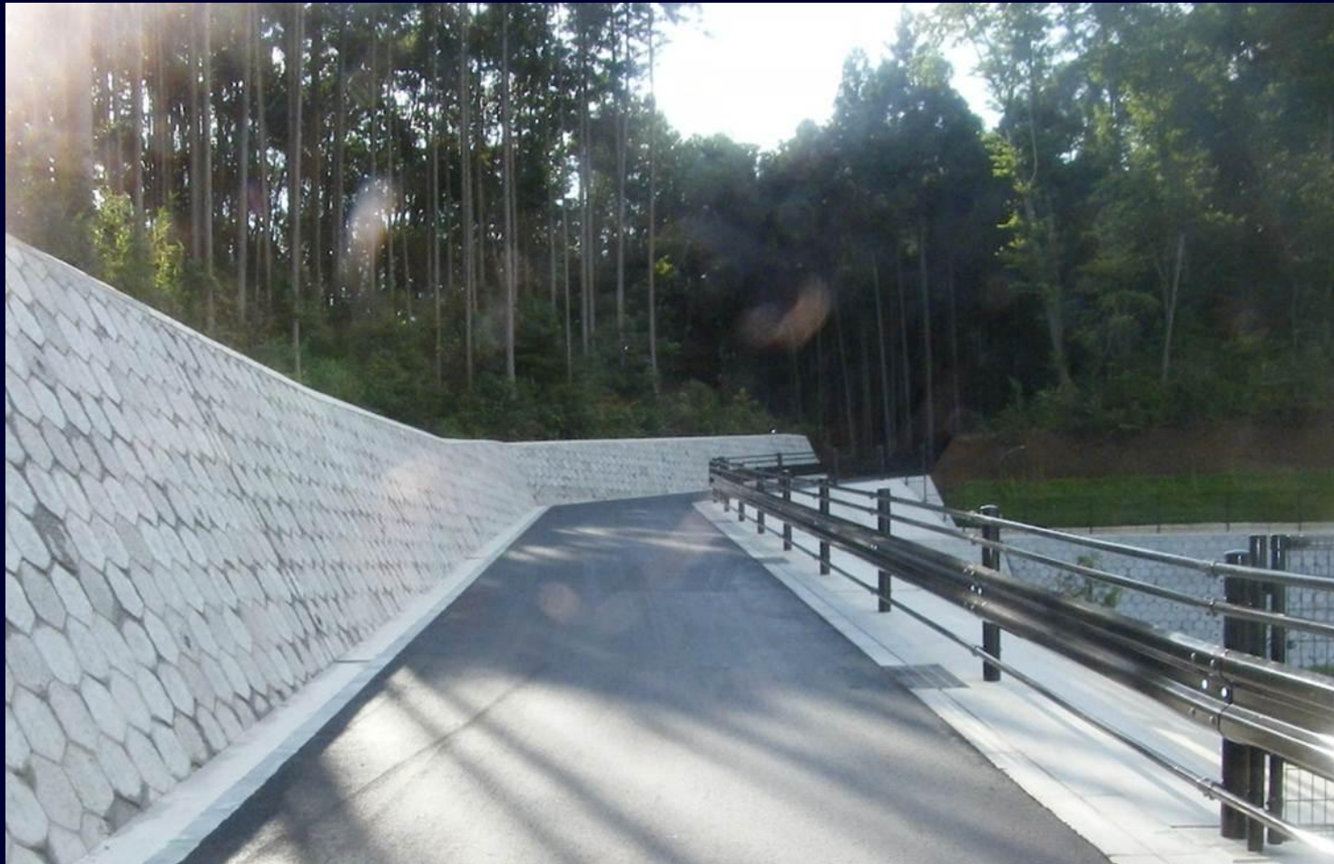
公園進入道路整備事業