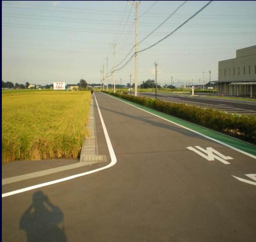
市道5777号線 (アクセス道路の新設)