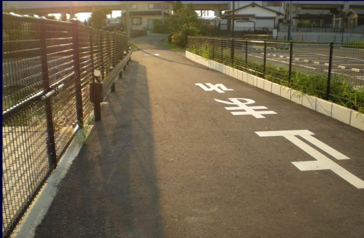
市道5744号線 (アクセス道路の新設)