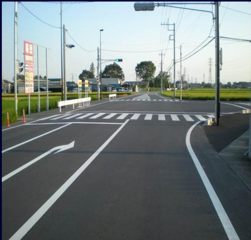
市道1380号線 (既存道路の拡幅・歩道設置)