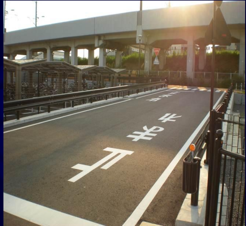
市道5778号線 (アクセス道路の新設)