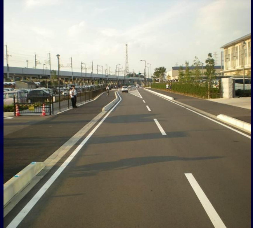
市道1753号線 (既存道路の拡幅・歩道設置)