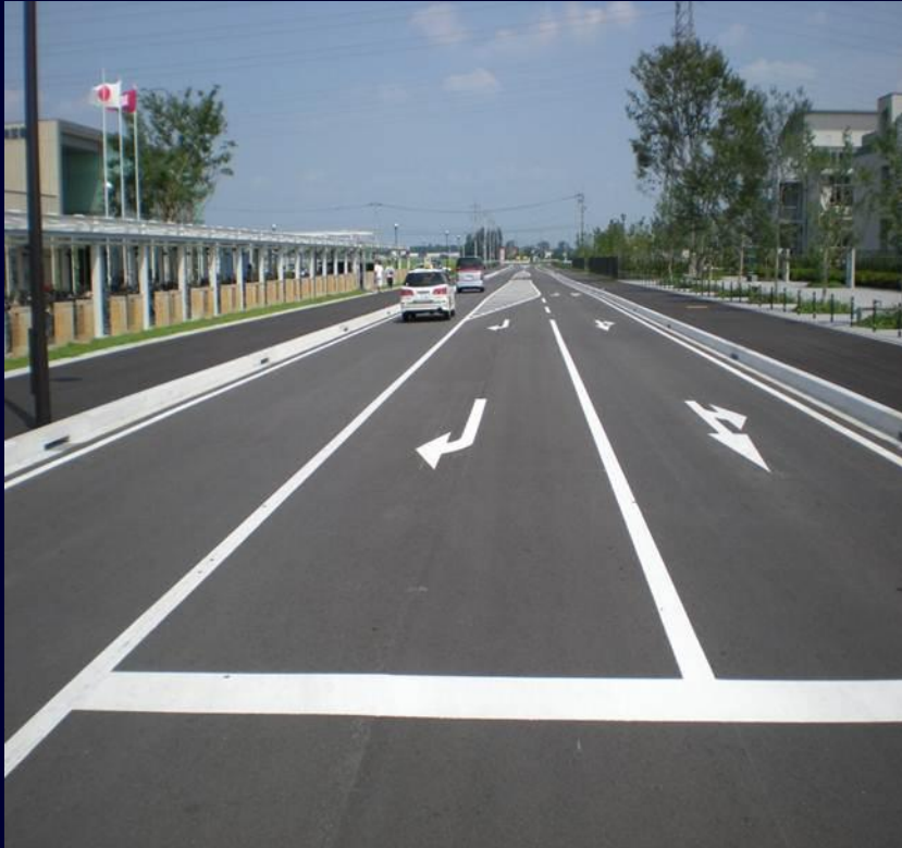
市道5730号線 (アクセス道路の新設)