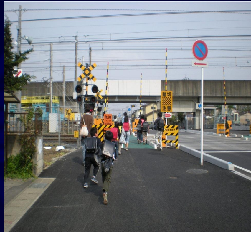
市道713号線 (既存道路の拡幅・歩道設置) (羽牛田街道踏切道拡幅含む)