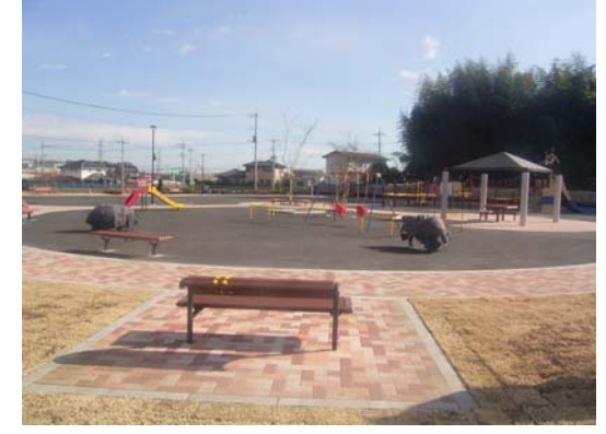
④街区公園整備事業（街区公園3号）