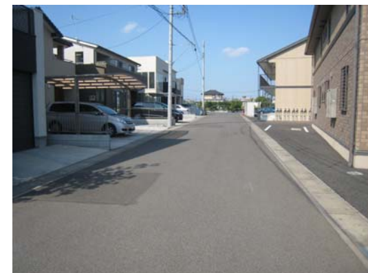
①鶴田第2土地区画整理事業地内 区画道路(1)