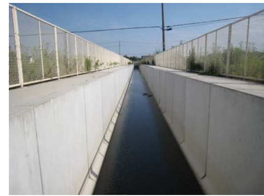
③鶴田第2土地区画整理事業地内 水路