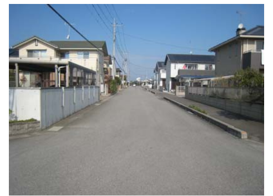
②鶴田第2土地区画整理事業地内 区画道路(2)