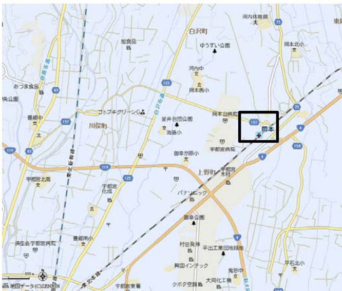
図 1 位置図

現在、駅前広場や橋上駅舎化、東西自由通路、土地区画整理事業などの各種整備事業が進められている中、岡本駅周辺の住民・事業者及び行政等が一体となって個性と魅力ある景観づくりを推進するため、平成 25 年より地元の自治会（三自治会）を中心とした「岡本駅周辺地区景観づくり検討会」を設置し、地域住民とその方策等について検討してきた。その後、平成 26 年には、検討会に関係機関を含めた「岡本駅周辺地区景観づくり推進協議会」を設立した。この協議会において、景観づくり指針（景観形成ガイドライン）を策定し、地域全体で岡本駅を中心とした景観づくり活動の取組みを進めている。… 図 1・2