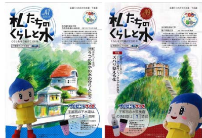
第47号（H27.9.6） 第49号（H27.12.6） 今市浄水場 第6号接合井