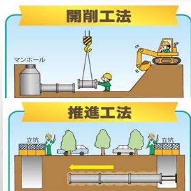
汚水管渠整備工事