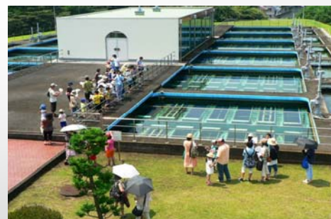
親子を対象とした施設見学会