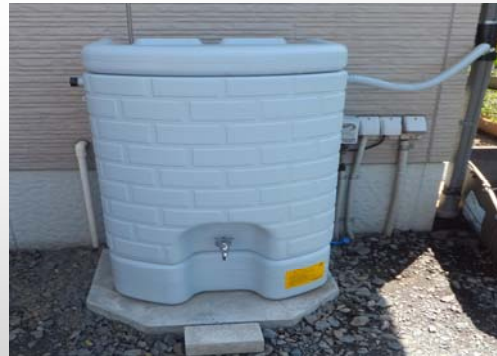
宅地内雨水貯留施設