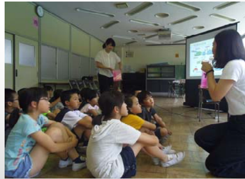
小学生を対象としたお届けセミナー