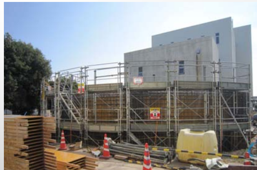
川田水再生センター設備更新工事