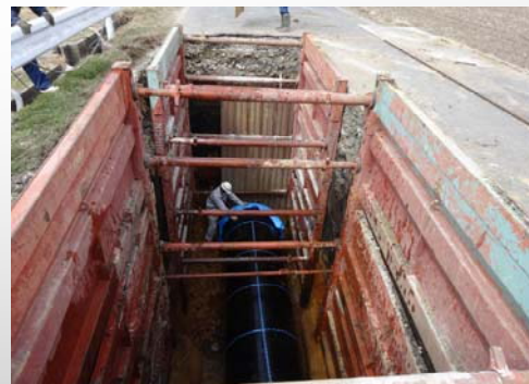
松田新田浄水場導水管耐震化工事