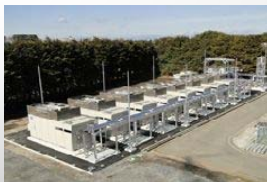
川田水再生センター消化ガス発電施設