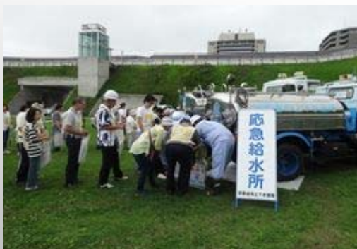
市民参加の応急給水訓練