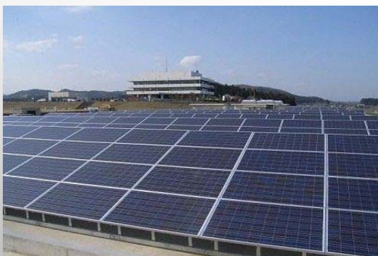
松田新田浄水場の太陽光発電設備