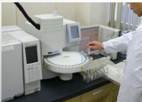
水質管理室による水質検査