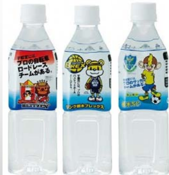
泉水のプロスポーツチームとのコラボ