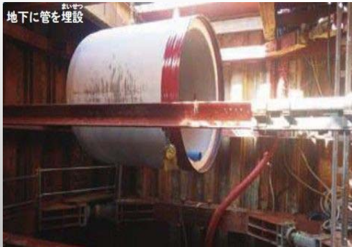
公共下水道雨水幹線の整備工事