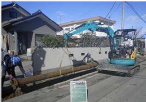
老朽配水管布設替工事