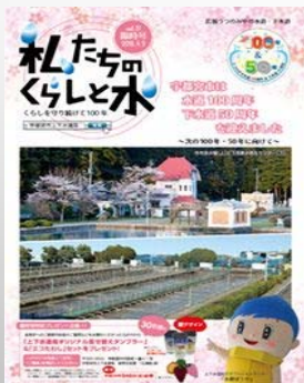
上下水道局の広報誌