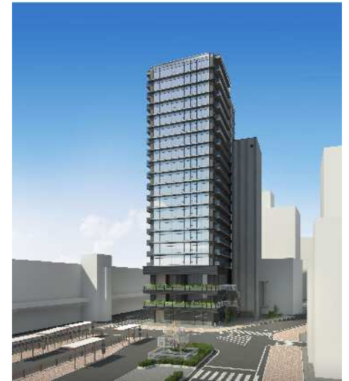
JR宇都宮駅西口南地区再開発事業