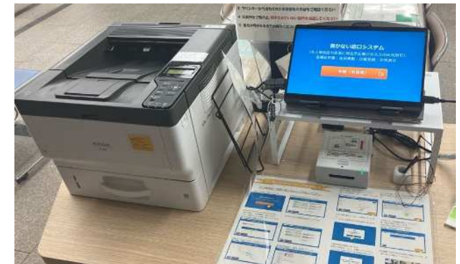
本庁舎や地区市民センターに導入する書かない窓口システム