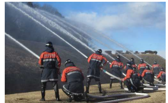
文化財防火デーに伴う消防訓練