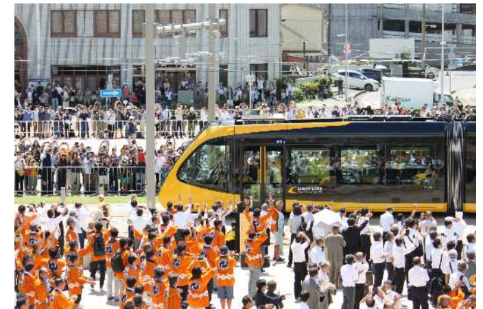
ライトライン開業イベント