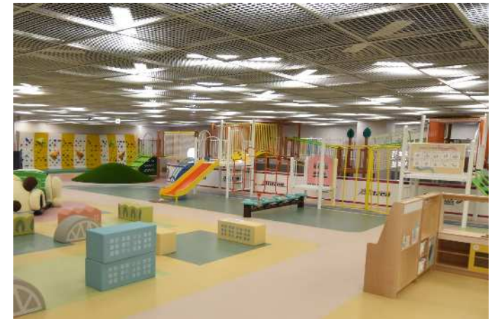
子どもたちのあそび広場「ゆうあいひろば」