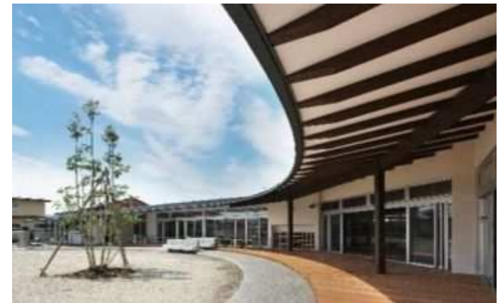
未就園児の定期的な預かりをモデル実施している「おためし保育園事業」