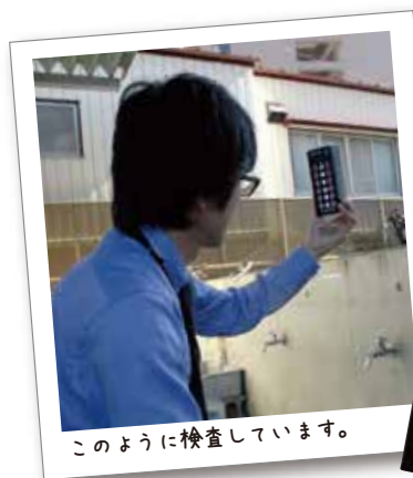
このように検査しています。