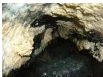
油が付着した下水道管の内部