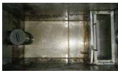
グリーストラップ清掃後