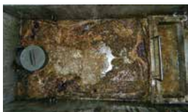
グリーストラップ清掃前

注:容量計算で清掃周期を決定している場合は、周期を守って清掃しましょう。 ※すくった油脂・清掃時の油脂は、焼却ごみとして処分しましょう。