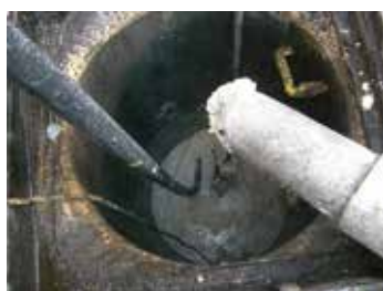
下水道管の清掃の様子