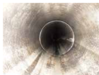
清掃後の下水道管の内部