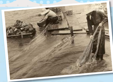
田川での水洗いの様子(昭和30年頃)