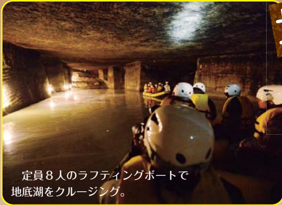
定員8人のラフティングボートで地底湖をクルージング。

暗闇と静寂に包まれた坑内の地底湖。ところどころに設置された灯りで水面の様子が確認できます。