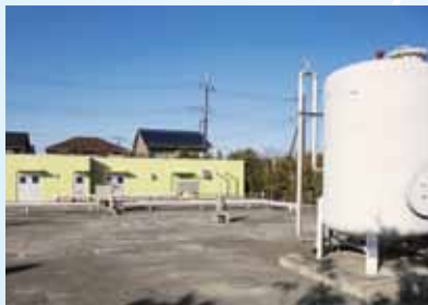
みずほの緑の郷地域下水処理施設