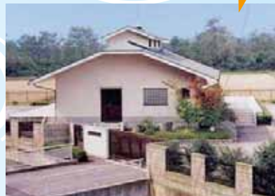
板戸地区農業集落排水処理施設