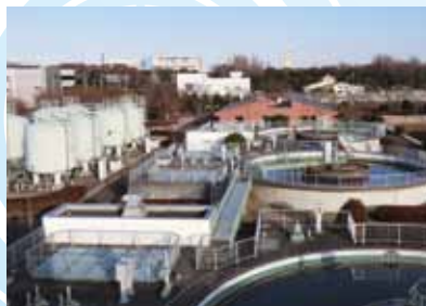
清原工業団地排水処理施設