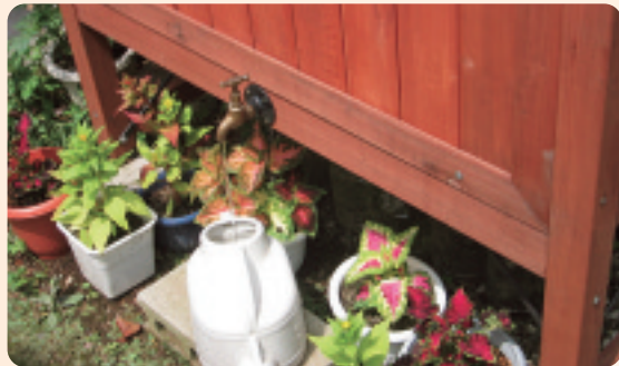
▲ ためた雨水をガーデニングに利用 (西川田本町 御子貝様のお宅)