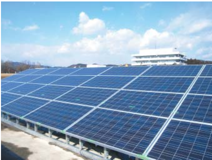
整備が進む松田新浄水場の太陽光発電設備

上下水道局では、県内の水道事業体に先がけて、浄水場に太陽光発電設備を整備しており、4月から発電を開始する予定です。発電量は水道事業体としては北関東一となります。さらに今後、水の力を活用した小水力発電設備も導入する予定です。