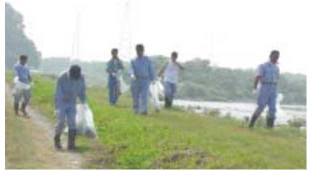
▶ 7月17日には、上下水道局職員と宇都宮市管工事業協同組合員が鬼怒川・小貝川サミット会議主催の「クリーン大作戦」に参加し、鬼怒川上流の河川敷で清掃活動を行いました。