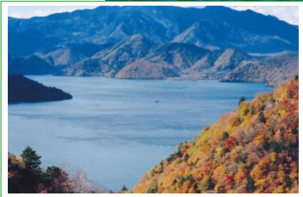
中禅寺湖展望台より中禅寺湖を望む

四季おりおりの風景を楽しむことができる中禅寺湖の湖畔にはいつもたくさんの方が訪れます。鮮やかに色づく紅葉と湖に映る男体山は見ごたえ十分です。