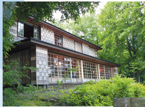
イタリア大使館旧別荘