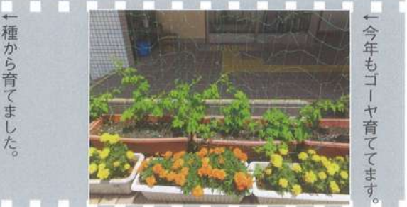
←今年もゴーヤ育てています。←種から育てました。