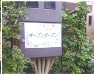
桜3丁目 徳原さん宅 5月末 全種類のバラが開花(徳原さんイチ押し) 9月 秋バラ