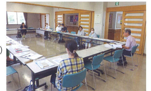
定例会の様子です