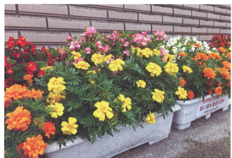
まちづくり協議会と交通安全協会桜支部がすすめている緑化活動

社協は、自治会など各種団体の協力を得て、ひとり暮らし高齢者会食会やサロン活動敬老会など地域の福祉活動を