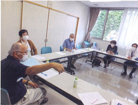
第1回つながり研究会の様子

桜地域のまちづくり協議会や自治会連合会、社会福祉協議会、民生委員児童委員協議会、老人クラブ連合会、女性の会、地域包括支援センター等多くの団体が構成員となっています。活動は、2か月に