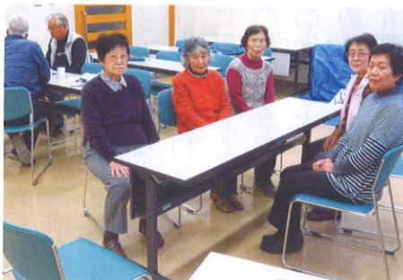
女性は楽しくおしゃべり、男性陣は、将棋に夢中

サロンを始めて2年がたちました。花見、美術館見学、将棋おじさん(中学生も)達。折紙、輪投げ、ランチ、お茶を飲んだり、おしゃべり等。新年会は自治会に回覧し、参加者を募ります。交流が出来、その日が来るのが楽しみにになりますので、参加者が増えますように。(宮嶋雅子・文)