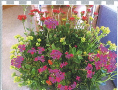
←地域の方が、お花がきれいに咲いたら届けてくれます。