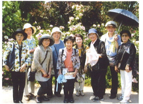
横浜イングリッシュガーデン

当自治会は、年間最大行事の「祭り」に関わるスケジュールに合わせて、永年共に協力し積極的に参加してきまし