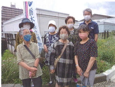
今年度最初のサロン 県立博物館見学