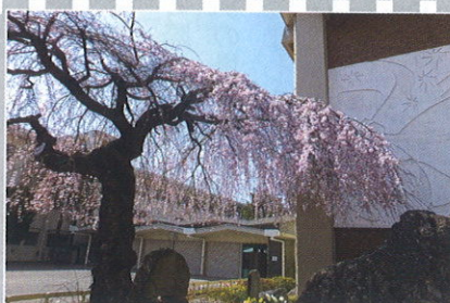
←桜小の桜は、今年もきれいに咲きました