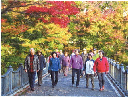
紅葉を眺めながら早朝ウォーキング

諸行事は当自治会の先人諸氏が更なる「会員のふれあい」を主眼に立案・策定し育んできたものです。幸い会場となる桜小・桜コミセン・中央公園・カラオケ店いずれもが徒