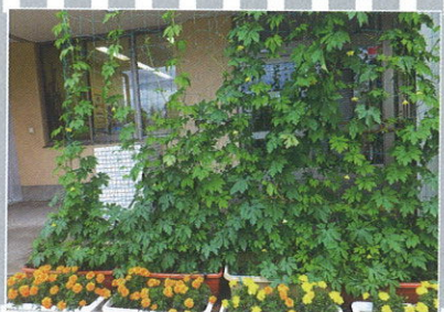
←今年もゴーヤ育てています。