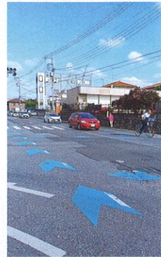
6月8日(月) 8の日運動 交通安全推進協議会