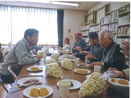
餅大好きな男性高齢者の面々

4年前ふれあい音楽会として発足し、現在はいろいろな年代の方が参加できるよう、三種の催しを工夫して実施しています。三種とは、高齢者向け、小学生・幼児向け、全世代向けの催し。輪投げ、みんなで歌う、綿あめ・ポップ